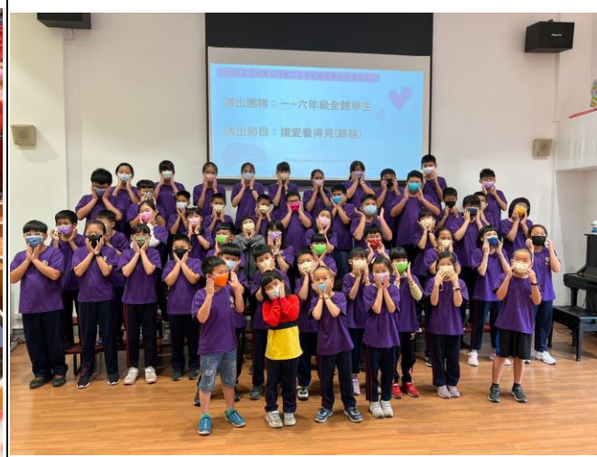
◆ 演唱家庭日主題曲「讓愛看得見」。