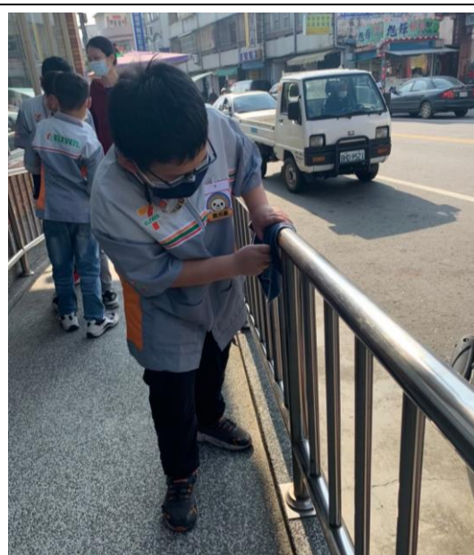
◆ 博幼活動—小七小小店長活動(社區附近的小七)